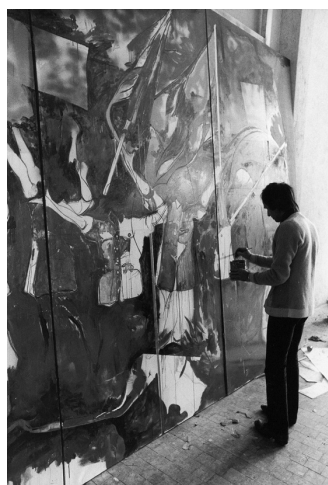
Mario Schifano al lavoro nel suo studio